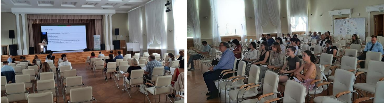
During the workshop

The workshop «Environmental governance systems in transboundary contexts» took place on the venue of Pskov State University (Pskov, Russia) on July 26-27, 2021. For the detail program, see Annex.